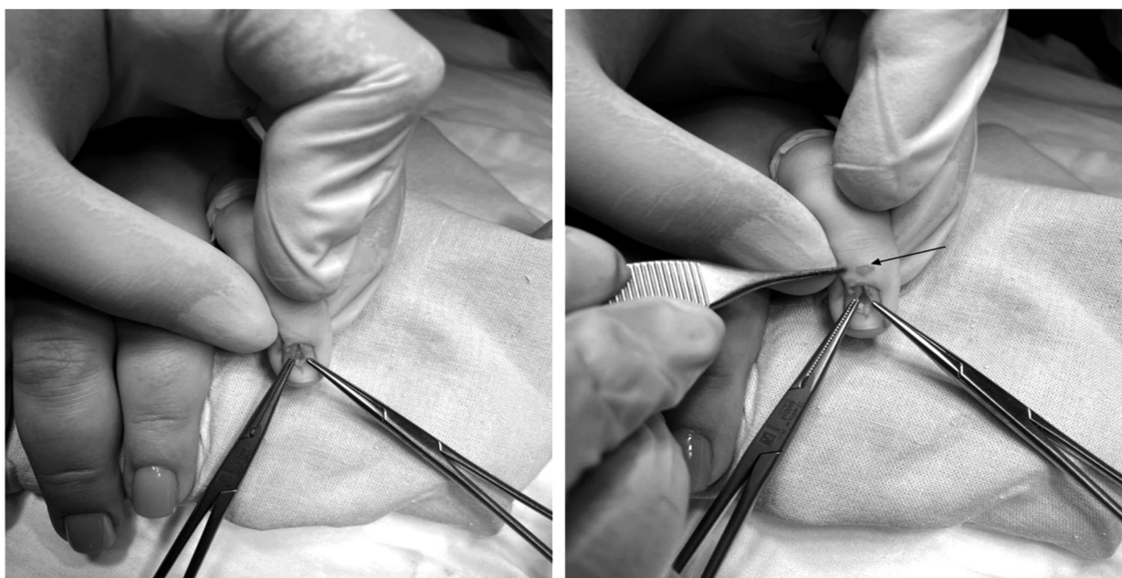
Рис. 3. Хирургическое удаление опухолевой массы

название «болезнь Барре–Массона» («болезнь Вуда»). Гистологически гломусное тело образовано прегломусными артериолами, отходящими от мелких дермальных артериол, и содержит эпителиоидные гломусные клетки, играющие ключевую роль в регуляции кожного кровотока в ответ на температурные изменения. волокон. Наибольшая концентрация