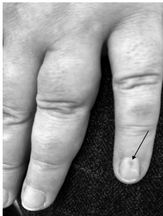
Рис. 1. Образование синего цвета в области подногтевого пространства пятого пальца слева

Сразу после операции у пациентки прошла боль, и в течение 4 мес. не отмечалось признаков рецидива (рис. 4).